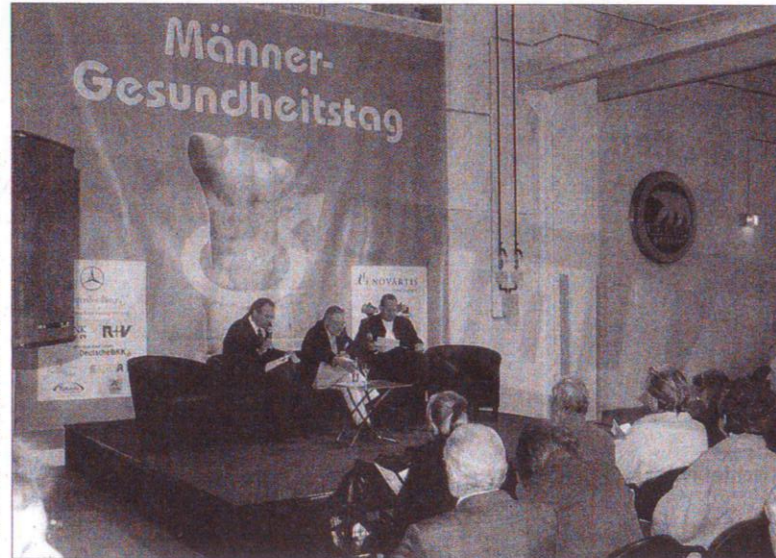
Der Männer-Gesundheitstag bietet verschiedene Talkrunden zum Thema Gesundheit.

Während vielfältige gesellschaftliche und politische Aktivitäten auf das Wohlergehen von Frauen und Kinder zielen, steht der Mann mit seiner Gesundheit im Abseits. Es ist aber offensichtlich, dass einer Vielzahl typischer Alterserkrankungen vorgebeugt werden kann. Voraussetzung dafür ist die Bereitschaft des Einzelnen, Prävention aktiv zu betreiben. Ziel des Vereins ist es, die